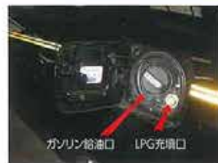
ガソリン給油口 LPG充填口