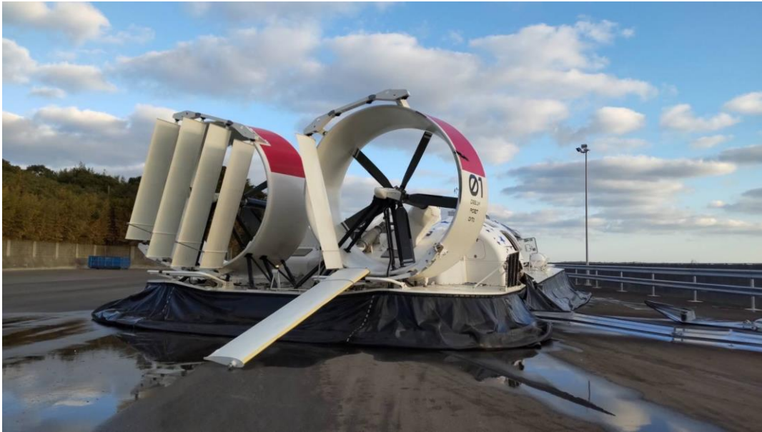
船外に出て状況確認