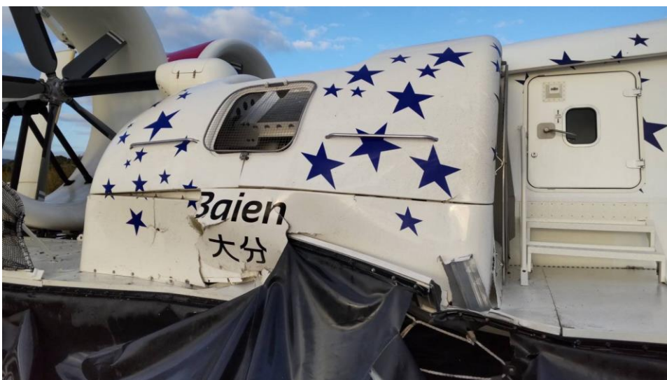
浮揚ファン支柱の破損